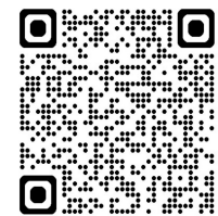
箱根観光情報新聞QRコード

なお、左記QRコードで過去の記事や画像、編集長の思い出などを紹介した本紙ホームページにアクセスできるのでお試しください。